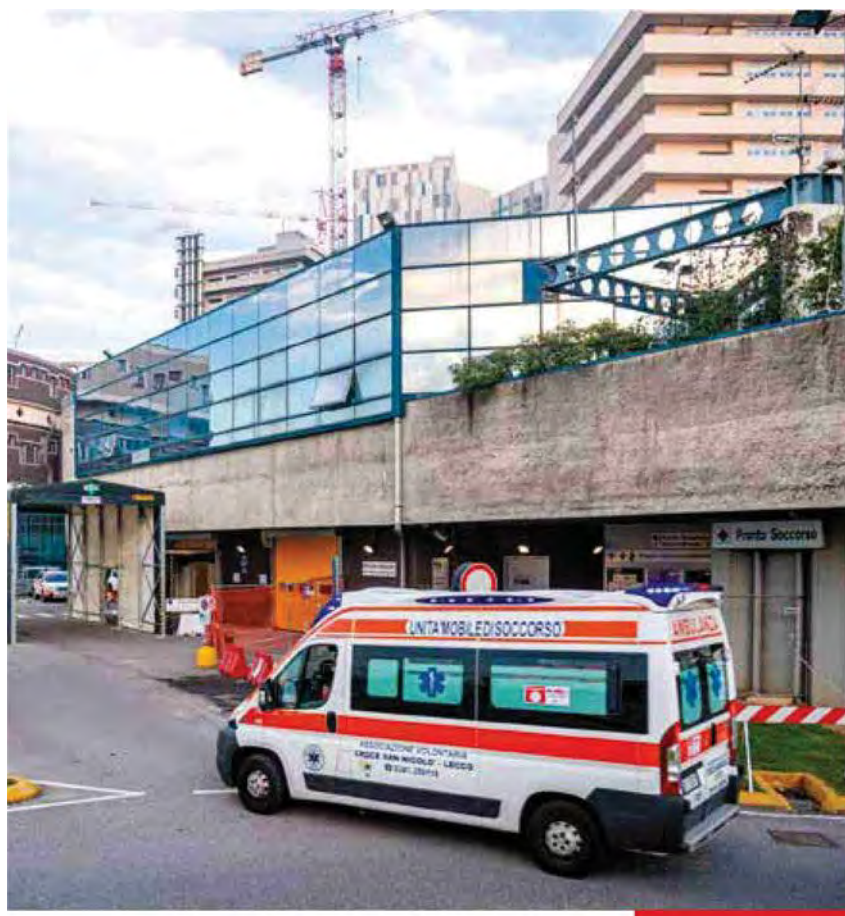
MONZA Ambulanza in arrivo all'Ospedale San Gerardo di Monza