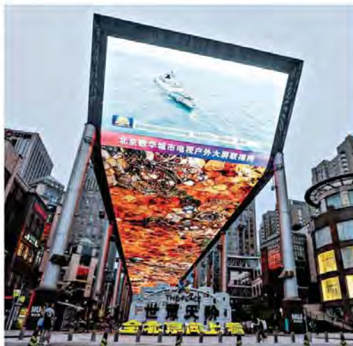
Pechino Uno schermo gigante trasmette le ultime notizie su Taiwan

di Filetto, Lignana, Preve e Vitale alle pagine 2 e 3