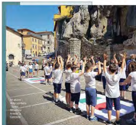
Gli alunni della primaria "Santo Giuseppe Artale" a Ceccano