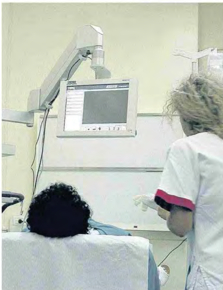
Tra le misure allo studio, anche l'istituzione di un Cup unico

Secondo un'indagine (Altroconsumo) su 1.100 cittadini intervistati, 950 hanno avuto problemi nel prenotare esami o visite