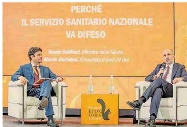
Il dialogo sul futuro del Ssn. Da sinistra Marzio Bartoloni e il ministro della Salute Orazio Schillaci

Nel 2023 secondo l'Istat 4,5 milioni di italiani hanno rinunciato a cure, 3 milioni per le attese