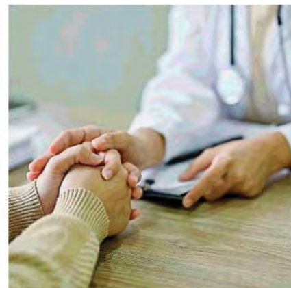
Al centro la nuova Pet attiva nel Campus Bio-Medico a Trigoria. Di fianco una dottoressa rincuora una malata