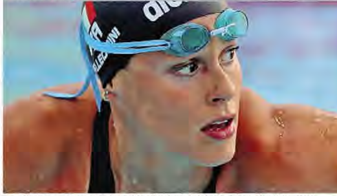
Federica Pellegrini, oggi 35enne, qui ritratta subito dopo il trionfo nella finale dei 100 stile libero al Foro Italico, nel 2019

Federica Pellegrini Il padre ex para come modello, la maternità, il futuro