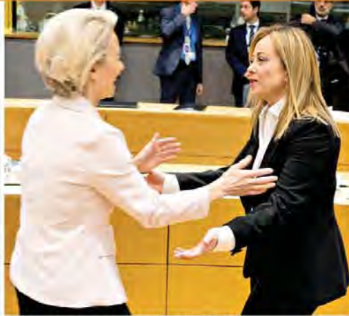
Bruxelles Ursula von der Leyen con Giorgia Meloni