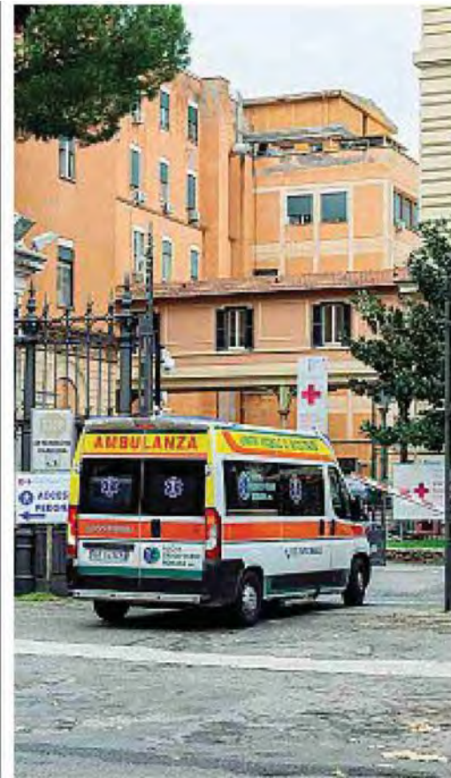
A sinistra una ambulanza mentre entra nel Policlinico Umberto I

2 milioni 200mila le prestazioni dei privati accreditati entrate nel Recup da gennaio