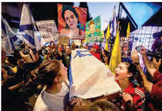
Manifestazioni a Tel Aviv contro la politica del Governo israeliano sugli ostaggi in mano ai terroristi di Hamas