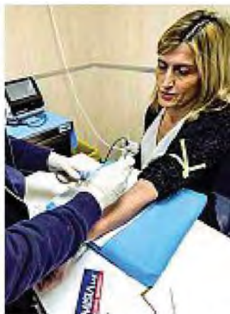
Prelievo di sangue a una paziente