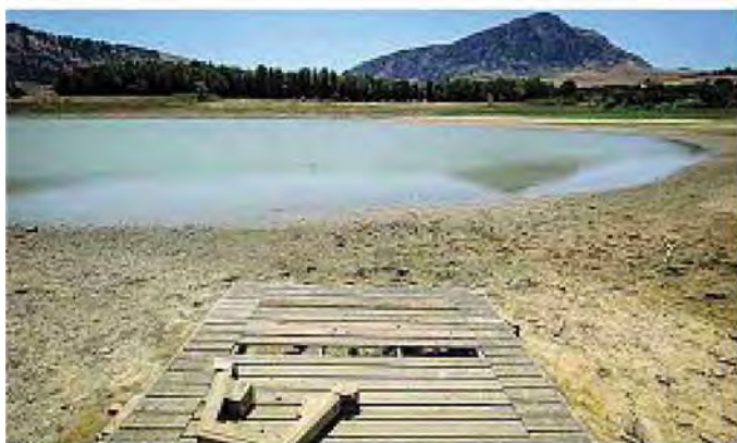
Siccità Il lago di Piana degli Albanesi, nel Palermitano, privo d'acqua