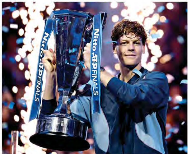
Maestro Sinner con il trofeo delle Atp Finals conquistato battendo Fritz