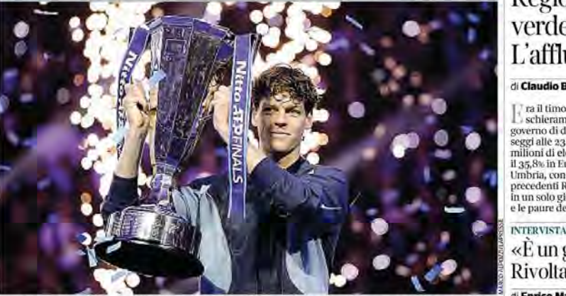
Jannik Sinner a 23 anni è il nuovo re del tennis. domina il trofeo dei «Maestri», batte ancora Fritz e conquista le Atp Finals di Torino

Tennis L'anno d'oro di Jannik, primo italiano a conquistare le Atp Finals