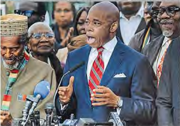
Il sindaco di New York Eric Adams, 64 anni, democratico, ex poliziotto, è stato incriminato per cinque capi d'accusa