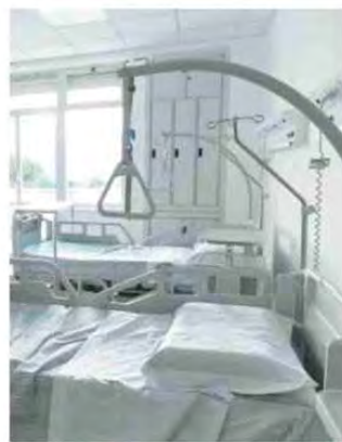
Un reparto di degenza