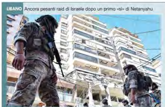
LIBANO Ancora pesanti raid di Israele dopo un primo «si» di Netanyahu

Francesco: «Stanno riemergendo anche qui inimicizie che sfociano in aperte ostilità» Nuova fornitura di armi americane all'Ucraina, minacce nucleari dalla Russia