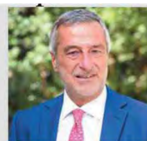
Nino Cartabellotta Fondazione Gimbe

blico, ma non per chi lavora nel privato. Abbiamo chiesto al governo di allineare le retribuzioni tra pubblico e privato». Investimenti chiesti anche da Nino Cartabellotta, presidente Fondazione Gimbe: «Nel 2010 la nostra spesa sanitaria pubblica pro capite era in media rispetto al resto d'Europa, oggi abbiamo accumulato un gap di 800 euro. Dobbiamo a tutti i costi rifinanziare la sanità pubblica. Visione, risorse e riforme sono le parole chiave per la sanità del futuro». (riproduzione riservata)