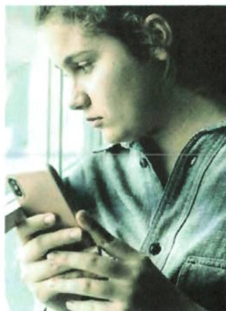
Uno studio condotto dall'Università di Amsterdam sui dati reali dei social media afferma che i "like" hanno il potere di modificare, spesso in peggio, lo stato emotivo di un ragazzo.

I GIUDIZI SUI SOCIAL POSSONO CONDIZIONARE L'UMORE DEI RAGAZZI PIÙ DEL PARERE DI GENITORI E COETANEI NELLA VITA REALE