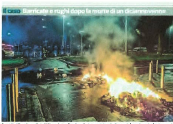
Guerriglia al Corvetto, periferia di Milano, dove nella notte settanta ragazzini con il volto coperto hanno bruciato alcuni cassonetti

Non è affatto detto che Trump abbandoni l'Ucraina al suo destino. Non è detto che sia nell'interesse dell'America. Chi in Europa ne temeva di più l'avvento, ora sembra fare maggior credito al nuovo presidente. Intendiamoci: che una soluzione della crisi richieda concessioni territoriali da parte di Kiev, de iure o de facto, provvisorie o definitive, è chiaro a tutti. Continua a pagina 30