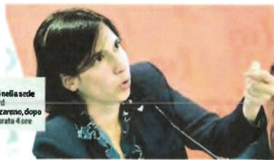
La segretaria Elly Schlein ieri nella sede nazionale del Pd in Largo del Nazareno, dopo la segreteria durata 4 ore

La segretaria intende occuparsi anche dei temi dell'impresa e della crescita in un giro dei distretti produttivi