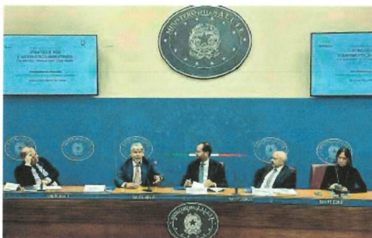
G7 SANITÀ La conferenza stampa tenuta da Marcello Gemmato

Per il Sottosegretario «è importante anche parlare delle buone pratiche e soprattutto ringraziare chi ne è fautore ovvero i medici veterinari che svolgono un lavoro eccezionale di sorveglianza e prevenzione, nel nostro sistema sanitario nazionale pubblico come in quello produttivo. A tutto ciò vanno aggiunti gli obiettivi presenti e futuri già delineati nel G7 di Ancona, come l'ingresso per la prima volta dell'Italia a livello internazionale nel sistema strutturale di incentivi per favorire lo sviluppo di nuovi antibiotici». Nell'ambito degli appuntamenti del G7, la Federazione delle Società Medico-Scientifiche Italiane (FISM), in collaborazione con il Ministero della Salute allestirà a Bari, il Villaggio della Salute. Dal 29 novembre al 1° dicembre piazza della Libertà si trasformerà in un grande polo di prevenzione, informazione e sensibilizzazione e accoglierà i cittadini in uno spazio unico, capace di favorire il dialogo e la collaborazione tra medici, società scientifiche, istituzioni, associazioni ed enti no profit.