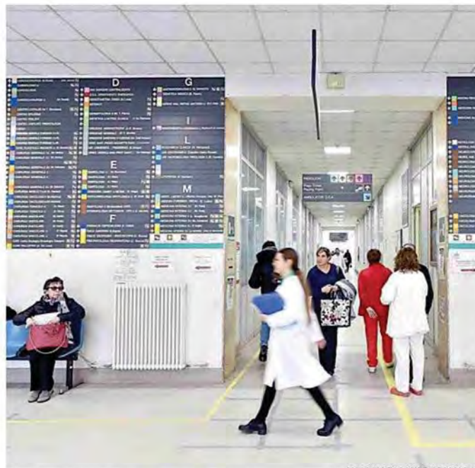
Il problema delle liste d'attesa nella Sanità è irrisolto da decenni

La seconda puntata dell'inchiesta uscita su La Stampa di sabato e dedicata alle liste d'attesa nella Sanità. Nell'articolo veniva raccontato il declassamento del provvedimento del governo, da decreto legge a disegno di legge