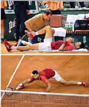
La sofferenza di Nole Djokovic prima del trionfo nella partita infinita al Roland Garros. Una rimonta incredibile con il ginocchio malconco