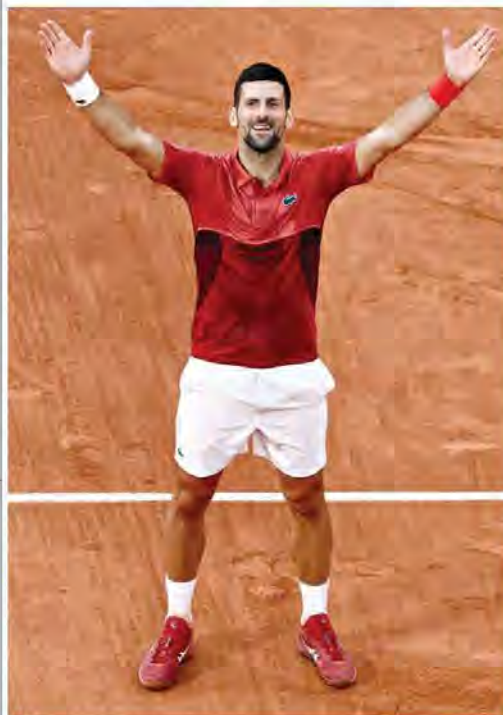
Roland Garros Djokovic batte Cerundolo al quinto set

Impresa Djokovic, soffre ma vince. Sinner deve attendere ancora