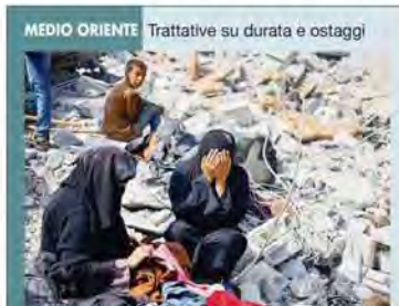
MEDIO ORIENTE Trattative su durata e ostaggi

Francesco: « Avvicinandoci a chi è nel bisogno, ci apriamo a Cristo. È lui che bussa » Il cardinale Czerny: no alla propaganda o all'uso ideologico in vista delle elezioni Ue