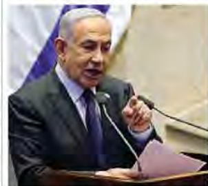
Il primo ministro israeliano Benjamin Netanyahu, 74 anni