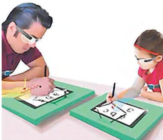
Un modello delle applicazioni di Conbots

Cinque atenei europei e tre aziende hanno lavorato con maestri e studenti di violino