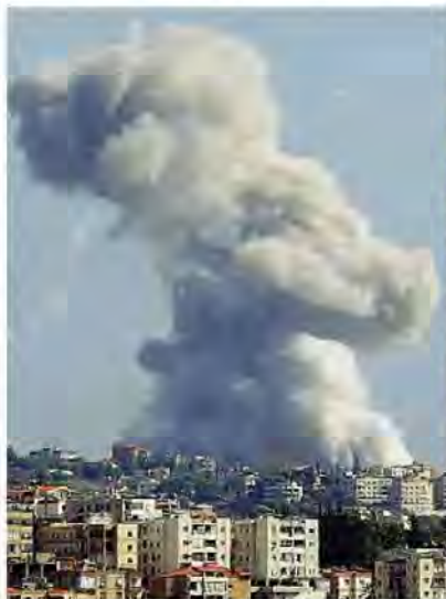
di Davide Frattini e Guido Olimpio da pagina 2 a pagina 5

Nuovi raid anche a Beirut, nel mirino il numero tre di Hezbollah. Quasi 500 morti, 35 bambini