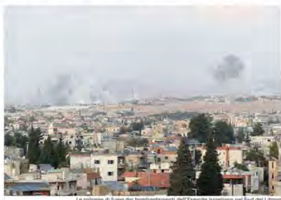
Le colonne di fumo dei bombardamenti dell'Esercito israeliano nel Sud del Libano