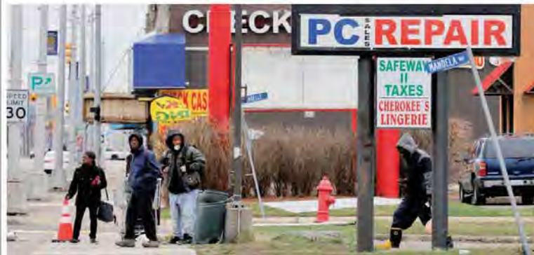
Woodward Avenue La strada principale di Highland Park, una delle cittadine più povere degli Usa

In Michigan, tra i dimenticati di Highland Park