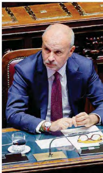
Ministro Orazio Schillaci

nel decreto legge 73 del 27 giugno 2024, pubblicato il giorno prima delle Europee. C'erano però norme utili per la gestione e il controllo delle liste d'attesa e la pianificazione di Regioni e Asl. Ma le Linee guida per la Piattaforma nazionale si discutono solo oggi con le regioni, di altri decreti attuativi non c'è traccia. E i termini sono scaduti. Doveva l'urgenza?