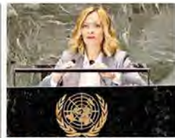
New York Giorgia Meloni all'Onu

Raid di Israele in Libano. Idf: colpiti più di mille obiettivi di Hezbollah. Oltre 490 morti. Popolazione in fuga dal Sud del Paese. Netanyahu: «Anticipiamo la minaccia». Meloni contro la riforma del Consiglio di Sicurezza dell'Onu: «Non crei nazioni di serie A e B». La premier non vedrà Biden né Zelensky.