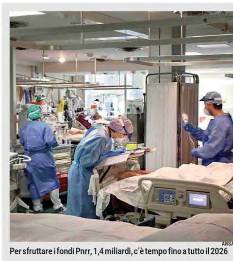
Per sfruttare i fondi Pnrr, 1,4 miliardi, c'è tempo fino a tutto il 2026

Insomma, a parte un gruppo di Regioni più o meno virtuose, per il resto è una debacle. Il sottosegretario alla Salute, Marcello Gemmato, ha chiarito che tutti i Piani regionali di potenziamento degli ospedali «sono stati approvati e hanno superato le verifiche degli organi di controllo». Peccato che oltre la metà dei posti siano rimesti solo sulla carta, con 1.082 letti in terapia intensiva e 1.398 in semi intensiva ancora mancanti. E non è che nelle regioni sia tutto un aprire di cantieri, nonostante il tempo stringa, perché per sfruttare il miliardo e 400 milioni stanziati dal Pnrr per realizzare nuovi posti letto c'è tempo fino a tutto il 2026, prima di perdere anche questo treno. PAO. RUS. —