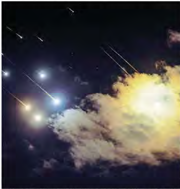
I lampi del sistema Iron Dome israeliano, qui sopra la città di Gerusalemme, attivato per intercettare i quasi duecento missili scagliati ieri dall'Iran

Chi avrebbe detto che un anno dopo la strage del 7 ottobre saremmo precipitati fino a questo punto? Il conflitto in Medio Oriente sembra sfuggito di mano a tutti i protagonisti: Israele, l'Iran con la sua galassia di organizzazioni terroristiche, l'America. Ieri c'è stato il grave attentato a Jaffa, e 181 missili dall'Iran su Israele. L'impressione di una spirale infernale, in cui ciascuno restituisce colpi all'impazzata senza calcolarne le conseguenze, deve però essere seguita da un bilancio più preciso. Tutto può ancora cambiare cento volte, ma oggi in difficoltà è soprattutto l'Iran. Quando il regime degli ayatollah diede via libera a Hamas per la carneficina di civili ebrei e la presa di ostaggi, di sicuro non voleva arrivare dodici mesi dopo al punto in cui si trova oggi. Ha visto decapitare le propaggini armate di Hezbollah e Hamas con cui terrorizza e ricatta il Medio Oriente da decenni. La sua credibilità è ridotta al punto che l'Iran oggi può apparire come una «tigre di carta», visto che anche la seconda ondata di attacchi missilistici contro Israele è stata neutralizzata, come già accade ad aprile. Sul terreno politico, il conflitto in Medio Oriente è entrato in una fase nuova e sta prendendo una piega sorprendente. continua a pagina 28