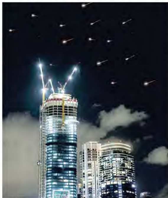
I missili iraniani nei cieli di Tel Aviv.