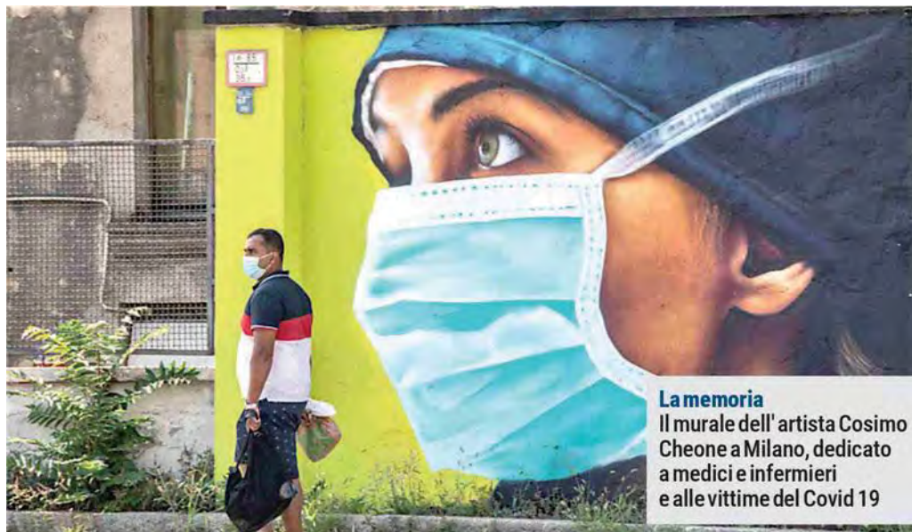
La memoria Il murale dell'artista Cosimo Cheone a Milano, dedicato a medici e infermieri e alle vittime del Covid 19

Preoccupa che solo un anziano su due si vaccini siamo scesi dal 65% al 50%