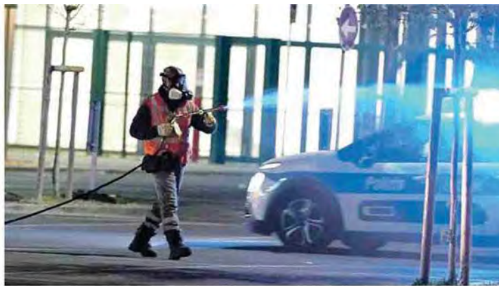
Disinfestazione delle strade a Perugia dopo un caso di Dengue

L'EPIDEMIA NELLE MARCHE. BURIONI: «IL VACCINO NON SERVE, VANNO ELIMINATE LE ZANZARE TIGRE»