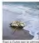
Lambruschi (inviato) a pagina 8

I parenti delle vittime: diamo un nome a chi affoga in mare