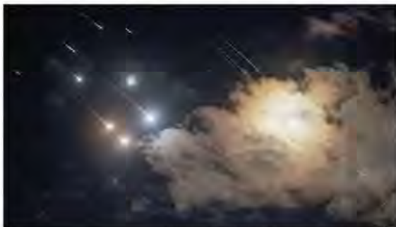
La pioggia di missili lanciati dall'Iran verso le città israeliane