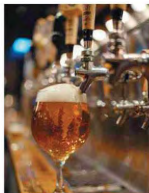
Studio innovativo sulla birra

Lo studio è seguito con interesse dalla comunità medico-scientifica perché le opzioni di trattamento farmacologico sono poche. Il piano prevede di coinvolgere nella ricerca 25 persone all'anno da qui al 2027.