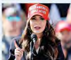
Governatrice Kristi Noem

di Carlucci, Cerami, De Cicco Sannino e Santelli alle pagine 6, 7 e 8