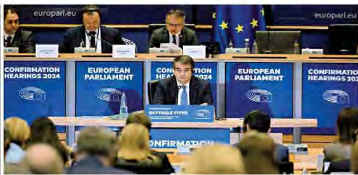
Parlamento europeo Il ministro Raffaele Fitto nell'audizione da commissario

BRUXELLES — «Non posso togliere la vicepresidenza a Fitto». Ursula von der Leyen deve correre nel Palazzo del Parlamento europeo. La sua futura Commissione rischia l'esplosione. E deve convincere socialisti e popolari ad abbassare i toni e a ridurre le pretese. Nel pomeriggio il gioco dei veti incrociati si trasforma in una roulette russa.