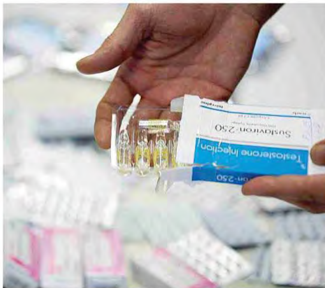
Merce sequestrata in un'operazione del Nas su anabolizzanti

Spesso sono prodotti smerciati in palestra per aumentare la massa muscolare. Ma col "fai da te" rischi enormi