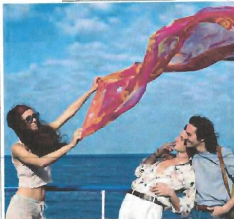
Sul set Una scena del film "Parthenope" di Paolo Sorrentino

Libertà e dolore di Parthenope in un film mistico e scabroso