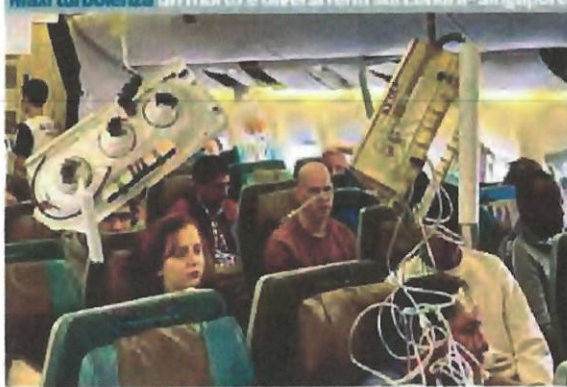
Passaggi del Boeing 777 della Singapore Airlines che, in volo da Londra a Singapore, è «precipitato» per 300 metri

Maxi turbolenza. Un morto e diversi feriti sul London-Singapore