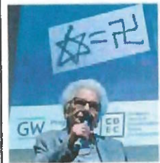
di Zita Dazzi a pagina 39 di Cafèri e Tercatini alle pagine 12 e 13

Liliana Segre: "Accusare Israele di genocidio è una bestemmia"