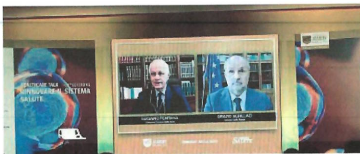
Il direttore del Corriere della Sera, Luciano Fontana, in collegamento con il ministro della Salute, Orazio Schillaci