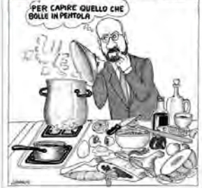
PER CAPIRE QUELLO CHE BOLLE IN PENTOLA

UNA CENA INFORMALE FRA I CAPI DI STATO E DI GOVERNO