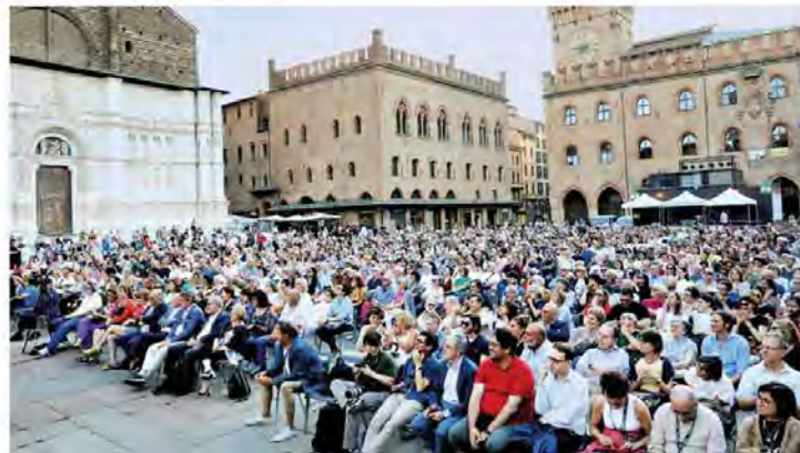
• Bologna il festival di Repubblica si è chiuso in una piazza Maggiore strapiena

A Bologna chiude il festival di Repubblica, una partecipazione straordinaria