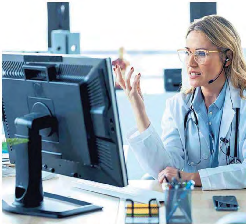
▲ Al computer Un medico al computer

Zone", ovvero quelle aree demografiche dove la speranza di vita è più alta che altrove, cade su Roma anche per le caratteristiche demografiche della capitale, una città dove l'età media sfiora ormai i 50 anni, ma soprattutto dove ogni 100 giovani ci sono 178 anziani, un numero sempre maggiore su cui ripensare le politiche abitative ma anche i business del real estate.